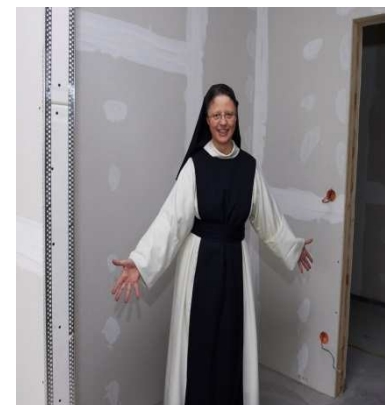
Einbauschränk € 1000