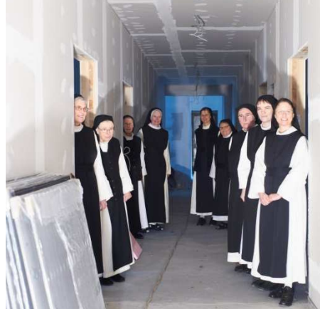
Der Holzfußboden für eine Zelle € 2800