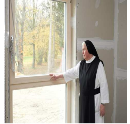
Ein Schreibtisch € 600