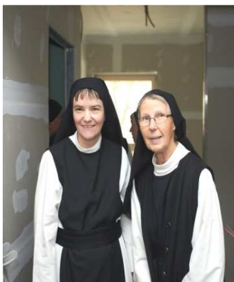
14 Nasszellen mit Dusche und Toiletten à € 5600