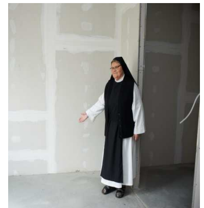
Ein Bett mit Nachtkästchen à € 800