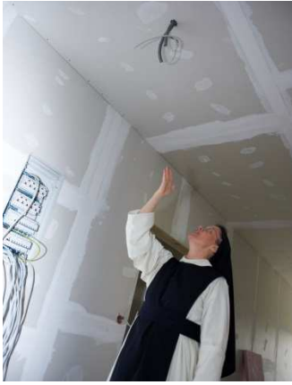
36 Lampen à € 120

14 Zellen à 20.80m 2 haben wir gebaut, davon die Nasszelle mit 4.50m 2