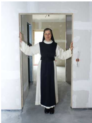
18 Türen à € 1900